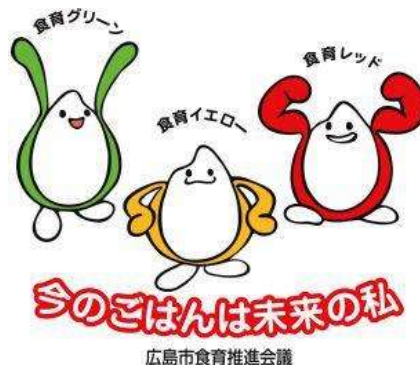
広島市食育推進マスコットキャラクター

期や注意点等にも言及した。最後に、噛ミング30の意義やその効果について解説し終了となった。