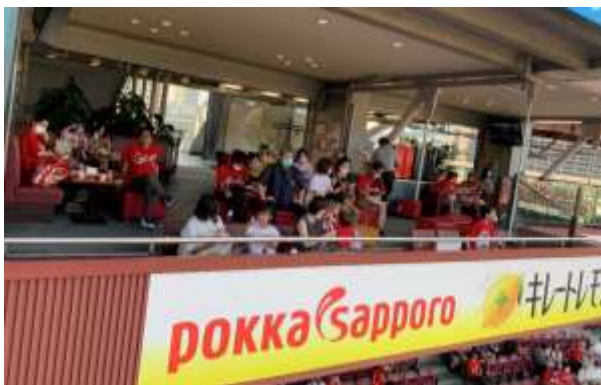
広々とした空間でゆったりと観戦する皆さん