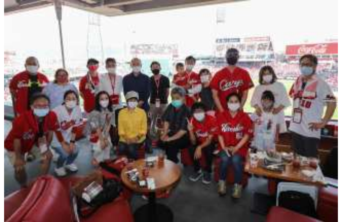
カープの広報の方に撮って頂いた思い出の集合写真