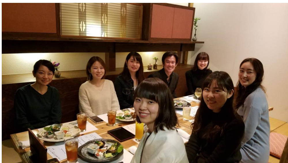
スタッフと歓送迎会

仕事と家族中心の生活を送ってきた私にとって、総務部の仕事はとて素晴らしい刺激になっております。未熟な点が多いですが、ご指導ご鞭撻のほどよろしくお願い致します。