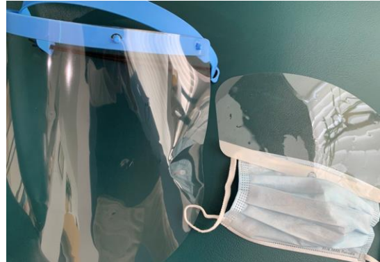
(左)フェイスガードと (右)マスクにつけるアイシールド