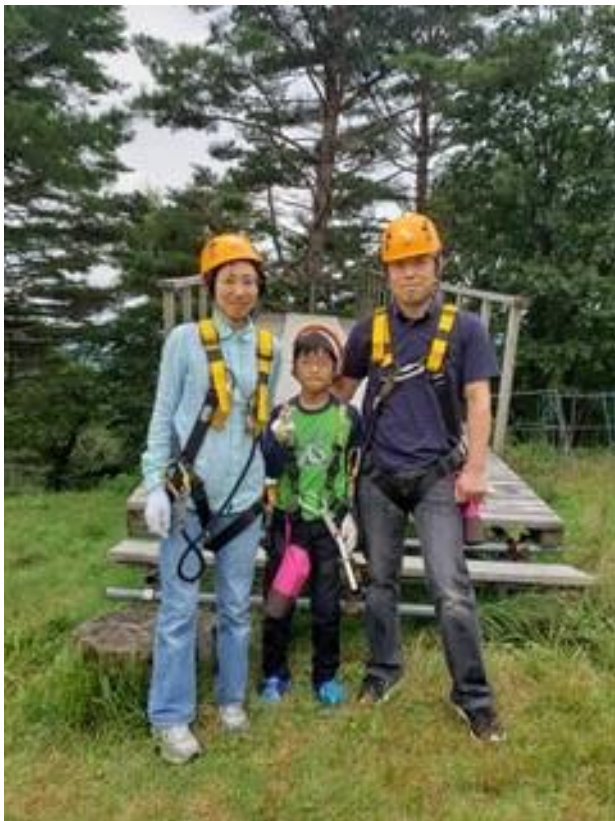
家族と恐羅漢ジップライン

歯科界全体は、これから苦しい時期になると思いますが、色々教えていただきながら、取り組んでいこうと思っておりますので、よろしくお願いいたします。