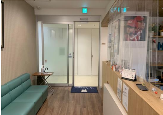
入り口に手指衛生用のアルコールと 受付にビニールシート